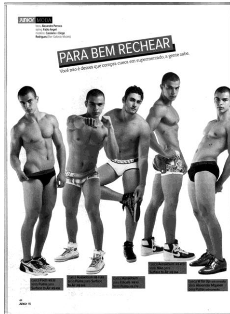
Fig. 2. Nos editoriais de moda a roupa de baixo vem para cima. ( Junior , número 15, pg. 44)

A partir da década de 1980 a “roupa de baixo” masculina deixou de ser elemento secundário no mundo da moda e conquistou certo protagonismo, sobretudo, na mídia gay. A cueca se revela então como um expressivo indício do corpo amalgamado com o que lhe fora periférico. Não há corpo sem a roupa, assim como não há nudez que não seja enunciada pela roupa, mesmo que mínima. Aqui vemos então como a roupa realiza o sujeito quase em dispensa do corpo biológico. Para Renata Pitombo, “a moda se oferece... como uma luva perfeita para aquele que deseja a diferença e o inédito na instância da aparência, marcando, assim, uma aparição individual, própria, personalizada” (2000).