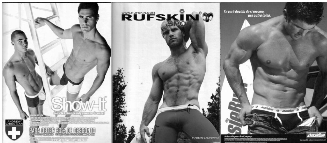
Fig. 3 . Os anúncios que valorizam o corpo masculino. ( Junior , números 11 e 14)